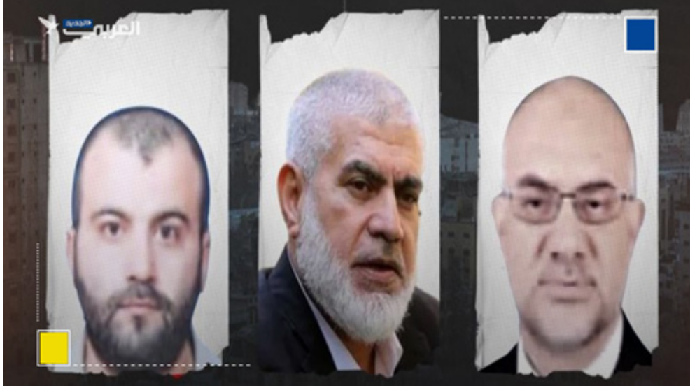
الاحتلال الصهيوني ياغتال السراج مشتهى وعودة..